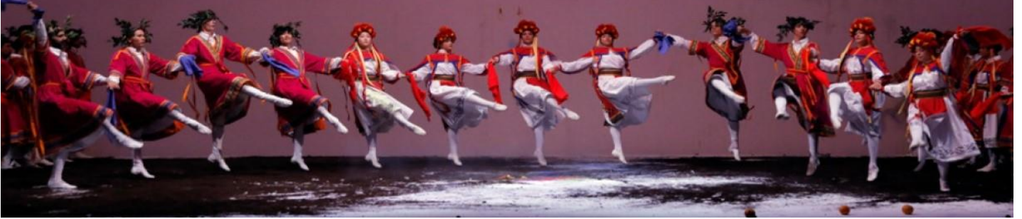
Aix-en-Provence's production of 'Requiem'

La relazione tra il tempo musicale e il tempo dei passi, aggiungendo una maggiore complessità. È necessaria una grande concentrazione per cantare e danzare contemporaneamente, ancor di più agire dei passi in un tempo differente da quello del canto. Questa credo sia stata la sfida più grande, ma che l'Ensemble Pygmalion, guidato dal grande Raphaël Pichon, ha affrontato e superato in maniera eccezionale.