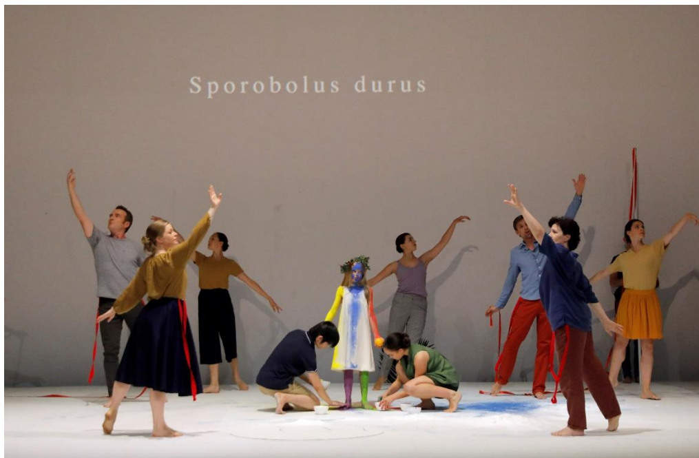
© Pascal Victor/ArtComPress. Aix-en-Provence's production of 'Requiem'

Sì, ma di formazione nel canto moderno. Sarebbe bellissimo lavorare con danzatori che siano anche cantanti lirici. Come lei Océane per esempio!