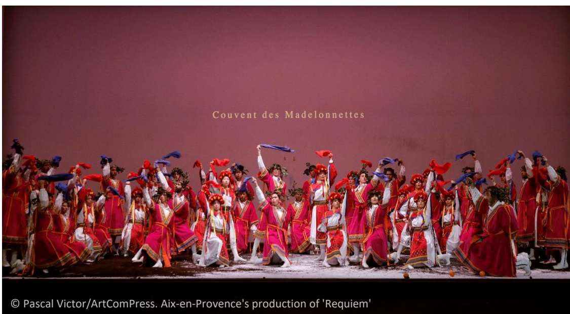
Aix-en-Provence's production of 'Requiem'

Lavorare con lui è un'esperienza arricchente. La dinamica del lavoro è caratterizzata da uno scambio continuo, fecondato dal principio del dubbio e della contraddizione. La sua generosità creativa e la sua mente affilata permettono di lavorare con serenità e lucidità in ogni situazione.