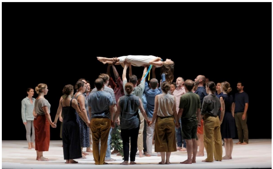
Aix-en-Provence's production of 'Requiem'

No, il lavoro è stato strutturato. Ho cercato di avere dei punti di riferimento, quando possibile musicali, a volte sul testo, in altri casi rispettando le necessità drammaturgiche. Anche nei momenti in cui si cercavano delle soluzioni e si proponevano delle azioni, o delle nuove danze, c'è comunque sempre stata un'idea forte e indicazioni precise.